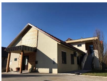
Slika 3: Bivalna enota