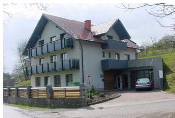
Slika 2: Enota Vinica Dnevni center se nahaja v najetih prostorih v pritličju stavbe.