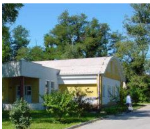
Slika 1: Enota Črnomelj Dnevni center Črnomelj

Vsebina sestankov strokovnih svetov je bila poleg predajanja tekočih informacij tudi strokovne dileme v pristopih pri delu kadar gre za obravnavo agresivnih motenj, posebnih vedenjskih težav, težav v odnosih, kako pristopiti k staršem in skrbnikom in kako izboljšati sodelovanje z njimi, sodelovanje z drugimi deležniki v občini Črnomelj, Metlika ali Semič ter kako organizirati delo ob pomanjkanju kadra.